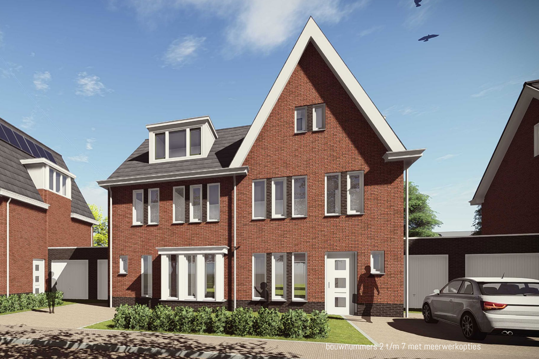
bouwnummers 2 t/m 7 met meerwerkopties