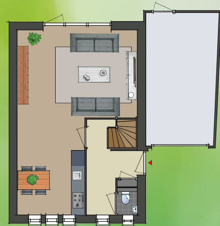
bouwnummer 1 (en 8 gespiegeld)

In deze plattegrond zijn meerwerkopties verwerkt.