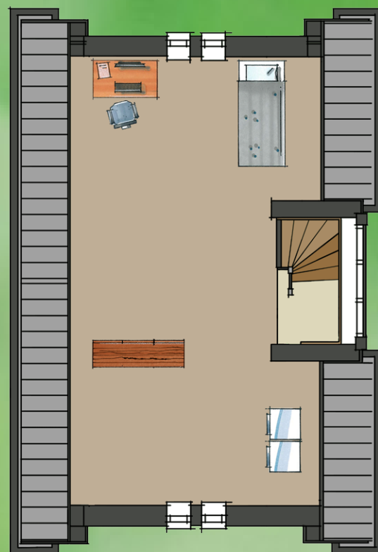
bouwnummer 1 (en 8 gespiegeld)

In deze plattegronden zijn meerwerkopties verwerkt.